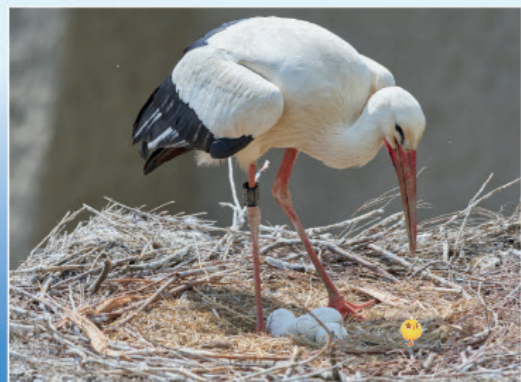
Un nid de cigognes

Des milliers d'oiseaux viennent au printemps donner naissance à leurs petits dans le parc du Marquenterre. Il est situé dans la baie de Somme. C'est une réserve naturelle, un territoire protégé, où l'homme ne peut pas s'installer.